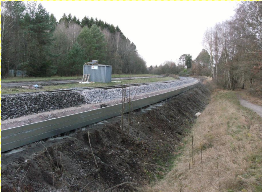
Heidebahn AG: Swietelsky Bau- gesellschaft mbH