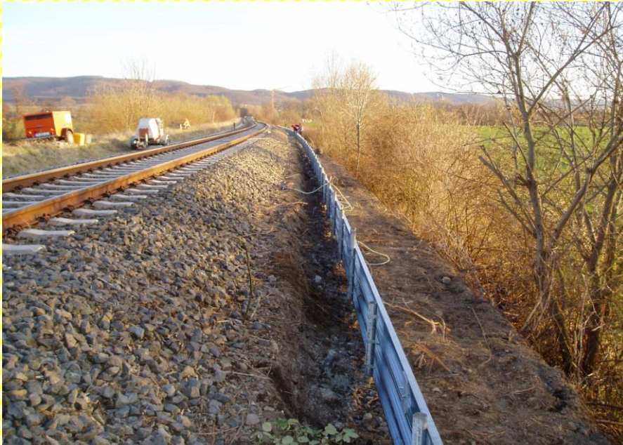
Halberstadt - Wernigerode AG: Deutsche Gleis- und Tiefbau GmbH