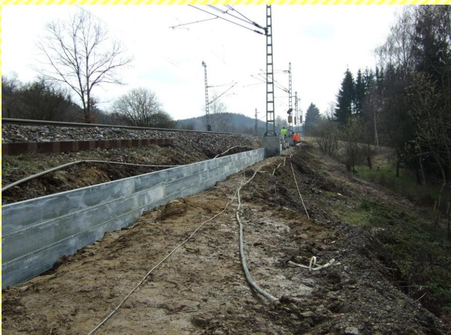
ESTW Gessertshausen AG: Deutsche Bahn Gleisbau GmbH